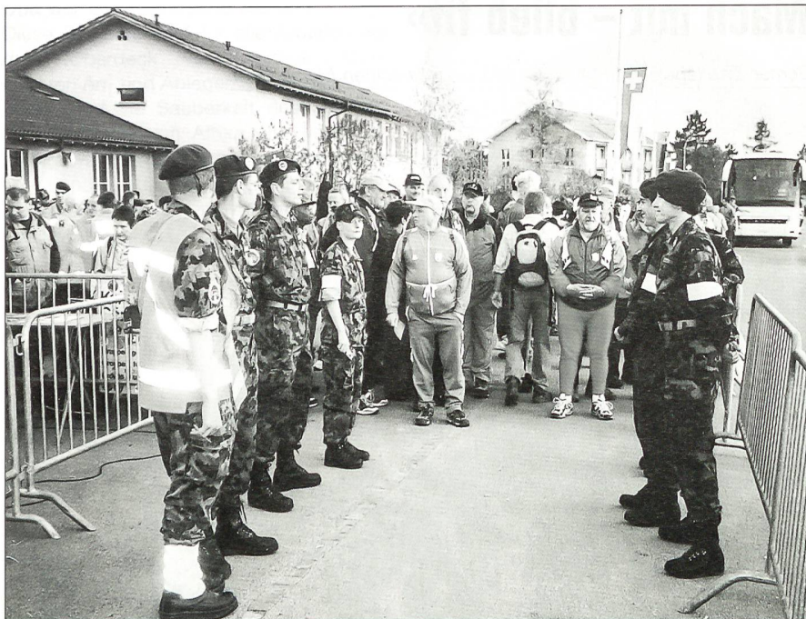
Gedränge vor dem Start am Sonntag zu den 20 km.