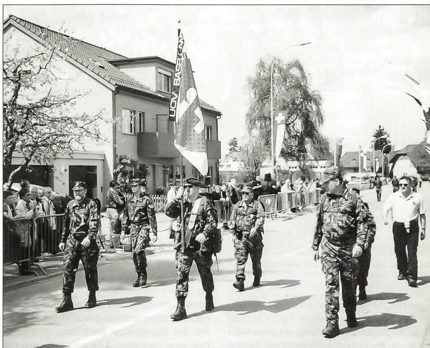
Die Marschgruppe des UOV Baselland sauber ausgerichtet.