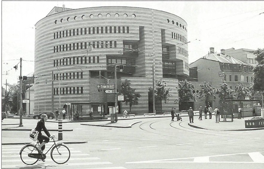
Am Aeschenplatz: der Botta-Bau der BIZ.

wie auch die Einheimischen sind immer wieder fasziniert von der Grossartigkeit des Münsterplatzes und der Gebäudefronten beidseitig des Rheines, hoch aufragend in Grossbasel, schlicht und harmonisch am Kleinbasler Ufer.