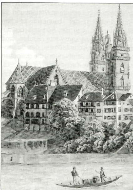
Blick auf das Münster

1804, zu Beginn der Mediationszeit, wurde als Nachfolgeorganisation der ehemaligen Stadtgarnison die Basler Ständekompanie (Stänzler) geschaffen. Ihr ob-