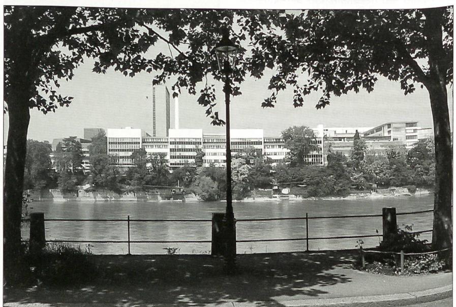
Blick auf die Basler Chemie (La Roche-Komplex).