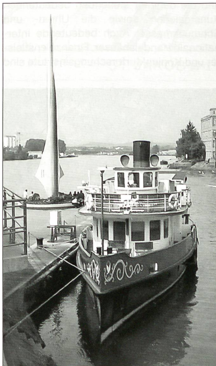
Am Dreiländereck (Schweiz, Deutschland, Frankreich) mit dem Nostalgieschiff Rhyblitz.

Das Stadtbild wird dominiert durch die grösstenteils gut erhaltene Altstadt und die Fortschreibung der baugeschichtlichen Stilrichtungen, von der Romanik bis zur Moderne. Bemerkenswerte Bauten sind das spätromanische Münster, das Spalentor aus dem 14. Jahrhundert, die gotischen Kirchen, so die Kirche St. Alban (11.–13. Jh.), speziell die ehemalige Barfüsserkirche (14. Jh.), welche das historische Museum beherbergt, die St. Leonhardskirche (14./15. Jh.), das Rathaus (16. Jh.) und viele Patrizier- und Zunfthäuser. Wichtig sind auch die Bauten in der so genannten Talstadt aus dem 19. Jh. und manche Architekturwerke aus dem 20. und angehenden 21. Jh., z.B. die Antoniuskirche, der Bau der BIZ, der für die UBS erstellte Repräsentationsbau von Botta, der heute auch der BIZ gehört, der Tinguely-Brunnen und das Tinguely-Museum, das Beyeler-Museum, das Schaulager und das neue Messe-Hochhaus. Besucher dieser Stadt