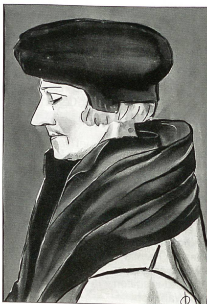
Erasmus von Rotterdam 1466–1536 (Bild von Hans Holbein d.J.)

Bereits um 500 Jahre v. Chr. entsteht im Norden der heutigen Stadt am Rheinknie eine keltische Siedlung. Um 44 v. Chr. gründet der Römer Munatius Plancus die bedeutende Stadt Augusta Raurica am Rhein, 10 km oberhalb von Basel. Um 15 v. Chr. errichten die Römer ein Kastell auf dem heutigen Münsterhügel. Der Ortsname Basilea wird urkundlich erstmals um 374 n. Chr. erwähnt. Ab 450 n. Chr., nach dem Zusammenbruch des römischen Reiches, siedeln sich die Alemannen an. Im Jahre 740 wird Basel Bischofssitz. Bischof Haito errichtet zwischen 802 bis 823 einen neuen karolingischen Münsterbau. Von