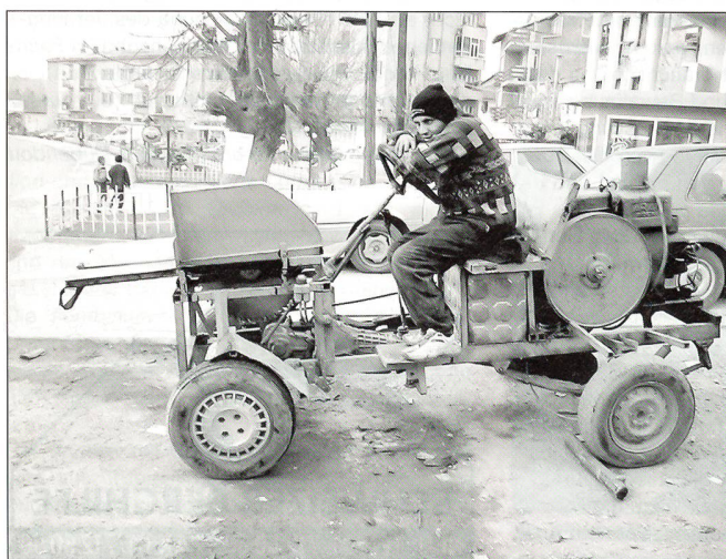
Kosovo-Harley in Suva Reka.

Die Redaktorin der Frauenseiten ist Ihnen gerne nach ihren Kräften behilflich und freut sich über viel Post mit gefreuten und allenfalls auch weniger gefreuten Berichten aus dem Militäralltag oder aus aller Welt.