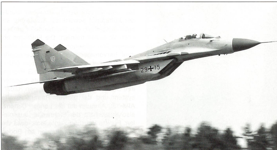
Die deutsche MiG-29 29+15 startet in Dübendorf zu einem Trainingseinsatz.

lin an der Medienorientierung in Dübendorf. Die 1. Staffel des JG 73 aus der Norddeutschen Tiefebene Mecklenburg-Vorpommern ermöglichte diese Premiere am Schweizer Himmel mit ihrem Besuch. Die Ausbildungszusammenarbeit mit der deutschen Luftwaffe entspricht den Auslandaktivitäten unserer Luftwaffe und basiert