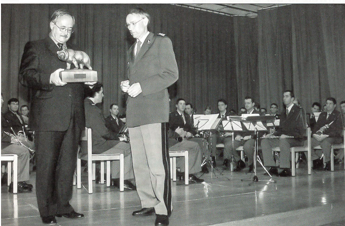
Der geschnitzte Bär aus Bern, überreicht von Bundesrat Samuel Schmid.