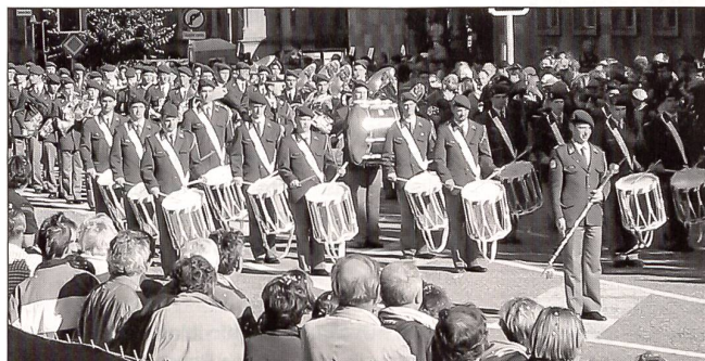
Um die 30 000 Zuschauer sahen den traditionellen Umzug am «Fête des Vendanges»