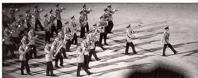
Das Orchester des Südlichen Militärbezirkes der Ukraine

Die gut funktionierende Partnerschaft zwischen dem Tourismusbüro Avenches und der Armee symbolisierte auch die zweisprachige Moderation durch Kurt Brogli und Oblt Fabrice Reuse. Die unzähligen positiven Publikumsreaktionen nach der Aventicum Musical Parade 2002 waren die verdiente Anerkennung und der Dank für nachhaltige Erlebnisse in einer einmaligen Kulisse. Das Tattoo war gleichzeitig ein krönender Abschluss der Kultursaison 2002 der Stadt Avenches.