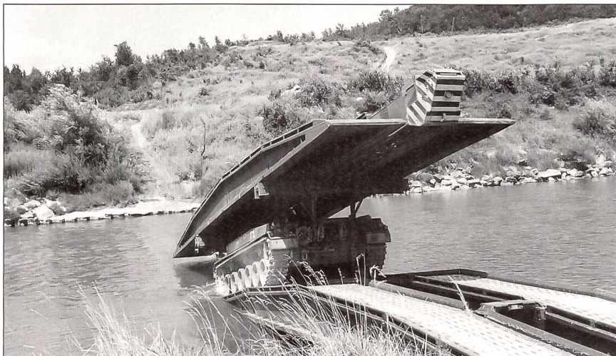
Die Brückenpanzer werden bis zum Jahr 2008 aus der Armee abgebaut.

Schmid an einer Medienkonferenz in Bern einschneidende materielle Entscheide be-