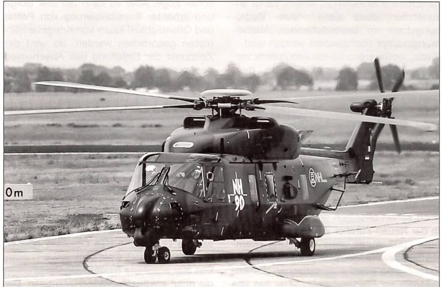
Der neueste Transporthelikopter NH-90, bestellt von acht Armeen.

Es ist daher verständlich, dass die Helikopterhersteller, vor allem in den USA, Frankreich und Grossbritannien, sich seit Jahren um einen brauchbaren Kompromiss bemühen. Leider ist ihnen dies nicht gelungen, da die Helikopter in der Praxis meist einen grösseren Aktionsradius besit-