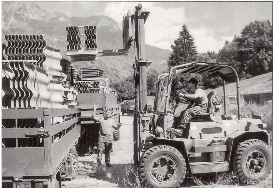
Die Anhänger werden mit Stapler beladen: Es kommt auf Millimeter an!

Der Soldat will beispielsweise seine Verpflegung sichergestellt wissen – möglichst warm – er möchte sein Material zur rechten Zeit, am richtigen Ort, in der richtigen Menge und Qualität vorfinden. Schlussendlich sollen mit dem richtigen Aufwand auch die richtigen Empfänger aller Güter und Dienstleistungen erreicht werden. Ein solch kompliziertes System erfordert nicht nur im Zivilleben durchdachte Strukturen, die in grösserem Umfang ohne Ein-