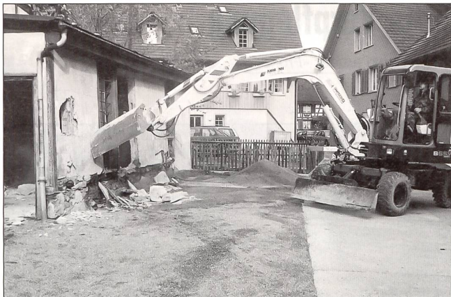
Damit die Rettungskräfte besser durchkommen, räumen die Armeeingehörigen einen Schuppen weg.