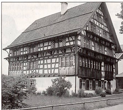
Dieser herrschaftliche Riegelbau im Herisauer Gemeindeteil Schwänberg war Mitte des 17. Jahrhunderts Sitz des Appenzeller Militärliebherrn Hans Conrad Zuberbühler. Heute sind gewisse Räume des Hauses öffentlich zugänglich für Bankette und Seminare, und ein kleines Museum veranschaulicht die Geschichte des idyllischen Weilers Schwänberg.

fenbar auch um eine einheitliche, ordonanzmässige Uniformierung seiner Kompanie bemüht, welche aus blauem Rock mit rotem Futter, weissen Hosen, weissen Strümpfen und weisser Weste sowie einem Hut mit aufgesetztem weiss-schwarzem