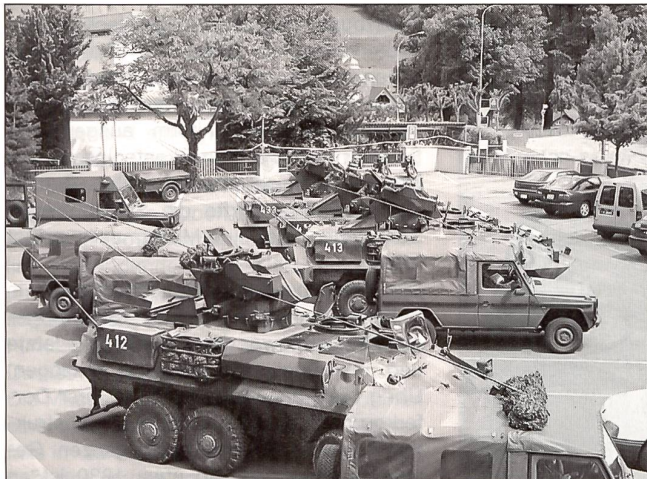
Die Armee ist auch bei Übungen stets ein gern gesehener Gast in Herisau: Erst kürzlich «besetzte» das Flughafenregiment 4 den Ausserrhoder Hauptort mit einer Panzerjägerkompanie, die diverse Aufgaben im Objektschutz zu erfüllen hatte.