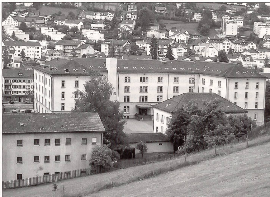
Die Kaserne Herisau: Hier ist einer der Ausbildungsstandorte, an denen die angehenden Berufsunteroffiziere auf ihre Aufgabe vorbereitet werden.

Bereiche der bestehenden Infrastruktur, die sehr gute Zusammenarbeit mit den