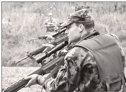
Ausbildung am Stgw 90 mit Zielfernrohr.

erforderte, musste in jeder Patrouille mindestens ein Einheimischer mitmischen. Es wurden also immer ein Gast und einer aus dem Reiat in ein Team eingeteilt.