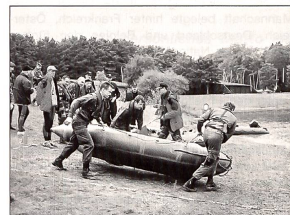
Start zur Schlauchbootfahrt.

Die CISM-Hindernisbahn im König-Baudoin-Stadion war sehr schwierig. Dies zeigte sich an