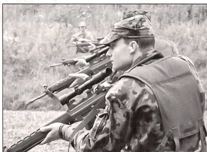
Ausbildung am Stgw 90 mit Zielfernrohr.

erforderte, musste in jeder Patrouille mindestens ein Einheimischer mitmischen. Es wurden also immer ein Gast und einer aus dem Reiat in ein Team eingeteilt.