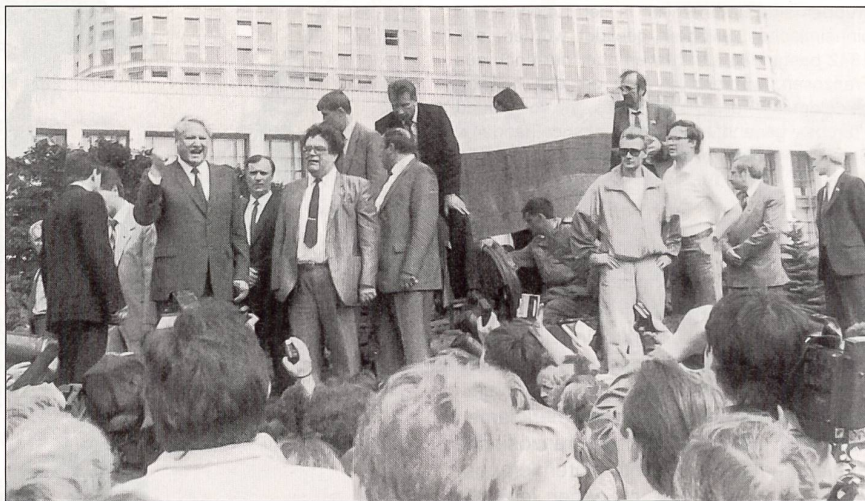
Höhepunkt des ersten Putschtages: Präsident Jelzin spricht am 19. August 1991 von einem Panzer aus zu Putsch-Gegnern. Im Hintergrund das Weisse Haus.

Als Michail Gorbatschow neuer Generalsekretär geworden war, holte er Jelzin nach Moskau in den zentralen Parteiparat. Jelzin wurde als Parteichef der mächtigste Mann der sowjetischen Hauptstadt. Ausserdem rückte er als Kandidat in den erlauchten Kreis des Politbüros, des höchsten Gremiums der Sowjetunion, auf. Er erhielt die Datscha, welche Gorbatschow nach seiner Ernennung zum Generalsekretär aufgegeben hatte. Die neue Position, die Jelzin nun errang, benützte er gezielt, um seine Ideen für eine Lebensverbesserung der einzelnen Menschen durchzusetzen. Er inspizierte Fabriken und Geschäfte, fuhr – etwas völlig Neues für einen Spitzenpolitiker in der UdSSR – mit der U-Bahn und reihte sich in die Schlangen vor Läden und Ämtern ein. Er versammelte die Moskauer Parteielite und verurteilte Prahlucht und die üble Gewohnheit, Erfolge übermässig zu betonen und Misserfolge zu vertuschen. Er ersetz-