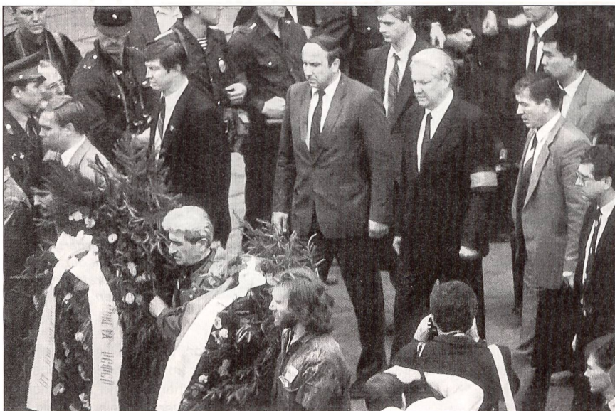
Boris Jelzin in Moskau an der Spitze des Trauerzugs mit den Särgen der drei Männer, die bei dem Putsch im August 1991 ihr Leben opferten.

Jelzin spricht von drei Leben, die er gelebt habe. Ein erstes schwieriges Leben, aber doch wie jenes der anderen Leute mit Studium, Arbeit, Familie und Karriere in der Wirtschaft und im Staat. Es habe an jenem Tag des ZK-Oktober-Plenums von 1987 geendet. «Danach begann mein zweites Leben als politisch Verbannter; plötzlich war ich von den Menschen abgeschnitten und kämpfte als Mensch und Politiker ums Überleben», hält er im Tagebuch fest. Im neuen Amt und Büro in Moskau, das ihn nun von der grossen Politik im sowjeti-