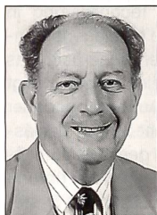
Autor: Oberst Werner Hungerbühler, Muttenz

Das Organigramm orientiert sich an den neu gebildeten Bundesämtern der Kampf-, Unterstützungs- und Logistiktruppen sowie der Luftwaffe. Der Untergruppe Personelles gehören auch die Dienststelle Frauen in der Armee, die Dienststelle Armee-seelsorge, die Zentralstelle für Soldatenfürsorge und die Aushebung an. Per 1. Januar sind 192 Personen übernommen worden, die 179 Planstellen belegen und im Laufe der Zeit auf den Planstellen-Sollbestand von 156 reduziert werden. Der hohe Startbestand war notwendig, weil der Übergang einmalige Zusatz-