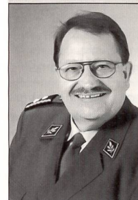
Unterstabschef Personelles der Armee im Generalstab Divisionär Waldemar Eymann