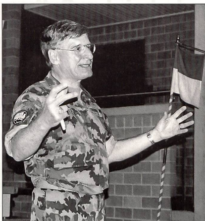
Divisionär Hans Gall kommandiert die Ter Div 4 und zeigte sich dabei sehr erfreut über die Motivation der Truppe und der realistisch angelegten Übung.

Das gesamte Flugplatzareal sowie die Umgebung von Payerne war sehr augenfällig durch eine starke Militärpräsenz geprägt. Gleichzeitig musste der normale Flugverkehr der Flugwaffe wie auch des Zusatzverkehrs infolge der Konferenz gewährleistet werden. Die Zugänge zum Flugplatzgelände waren streng durch Armeeangehörige in Schusswesten und mit Waffen, aber ohne Helm abgesichert. Wer über keine Zutrittskarte verfügte, wurde nicht hineingelassen.