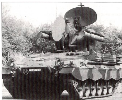
Roland (D; Marderchassis)