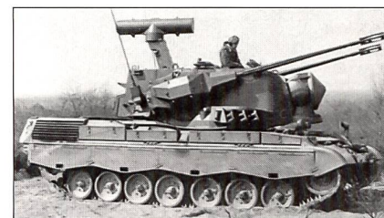
Gepard (D)/CA 1 (NED)