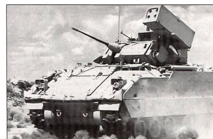
Bradley Linebaker (USA)

Im kommenden Quiz werden die folgenden Fliegerabwehrpanzer behandelt: