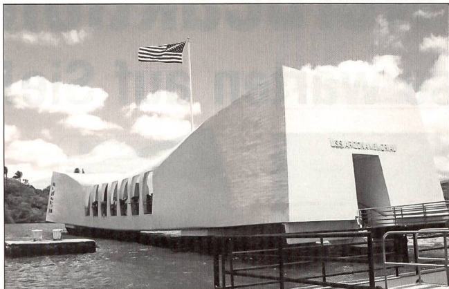
Über der gesunkenen USS Arizona ist diese Brücke errichtet worden. Sie dient als Gedenkstätte an den Tod von 1177 Seeleuten. Deren Schriftzüge sind alle beim Denkmal festgehalten. Das Denkmal wird jährlich von Zehntausenden von Touristen und Interessierten besucht.

schädigt. Die USA verloren 188 Flugzeuge und 159 Maschinen wurden beschädigt. Die Japaner hatten nur 29 Flugzeuge (etwa 10%) verloren. Der Überraschungsschlag war geglückt, der Sieg überwältigend, aber nicht vollständig. Die USA wurden gedemütigt, gleichzeitig hatte aber Japan den schlafenden Riesen geweckt, gereizt, erzürnt und gewaltige Kräfte freigesetzt. Die USA waren nun bereit, selber in den Zweiten Weltkrieg einzutreten, am 8. Dezember erklärten sie Japan den Krieg. Drei Jahre und 8 Monate später sollte die Niederlage des kaiserlich-japanischen Reiches besiegelt sein.