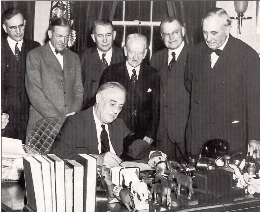
Einem Tag nach dem Überfall auf Pearl Harbor, am 8. Dezember 1941, unterzeichnete Präsident Franklin D. Roosevelt im Weissen Haus in Washington D.C. im Beisein von Mitgliedern des Kongresses die Kriegserklärung an Japan.

Die Besatzung war besonders beeindruckt vom erfolgreichen Überraschungsangriff der Briten im November 1940 mit 21 Swordfish-Torpedoflugzeugen vom Flugzeugträger HMS Illustrious auf den gut gesicherten italienischen Hafen von Tarent. Bei diesem waren sieben Schiffe, darunter drei Schlachtschiffe, schwer beschädigt worden. Tarent war im Ansatz durchaus mit Pearl Harbor vergleichbar (nur eine enge Ausfahrt, flache Gewässer). Zum Studium dieses Angriffs und der Auswirkungen war extra ein japanischer Marineattaché aus Berlin nach Tarent gereist.