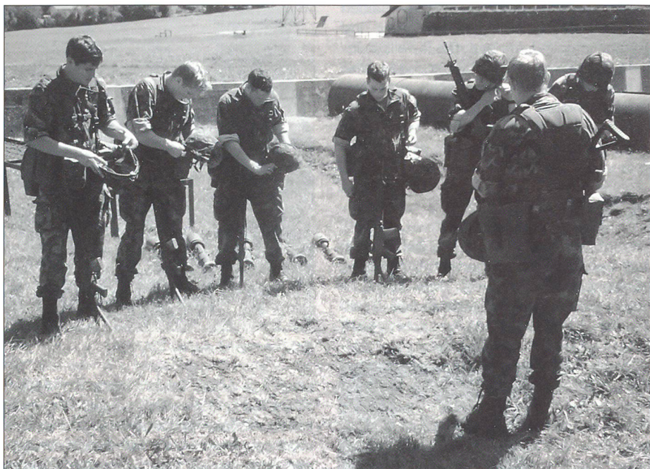
Durchdiener RS St-Maurice, Bereitstellen der Gruppe zur Übungsbesprechung.