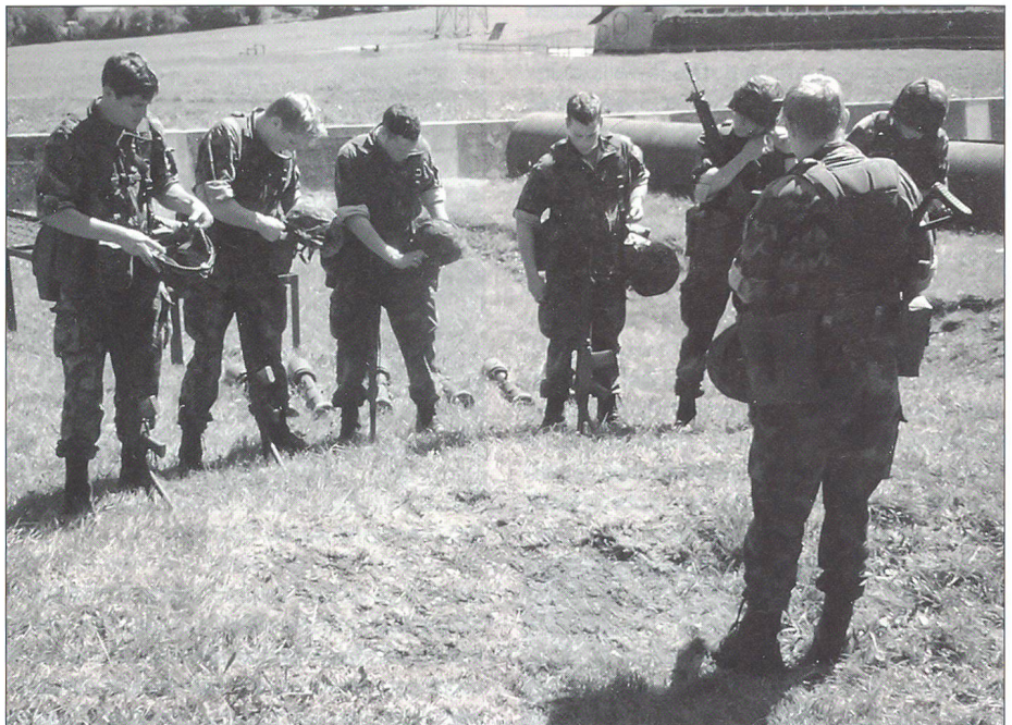
Durchdiener RS St-Maurice, Bereitstellen der Gruppe zur Übungsbesprechung.