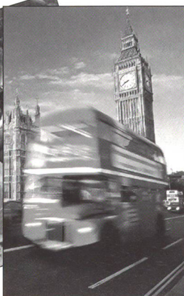
Städtereisen nach Paris oder London