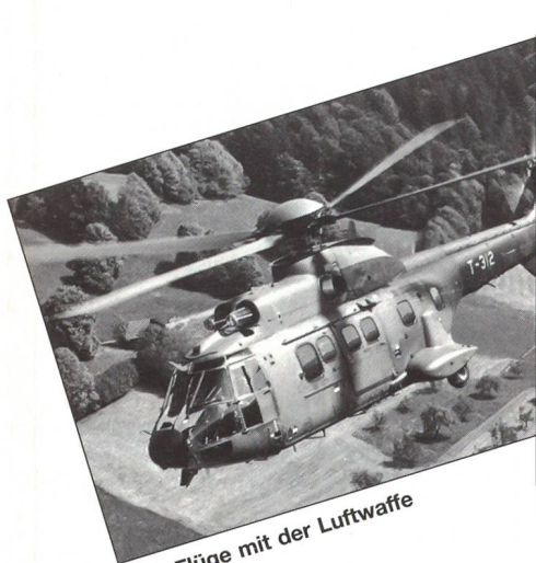
Heli-Flüge mit der Luftwaffe