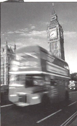
Städtereisen nach Paris oder London