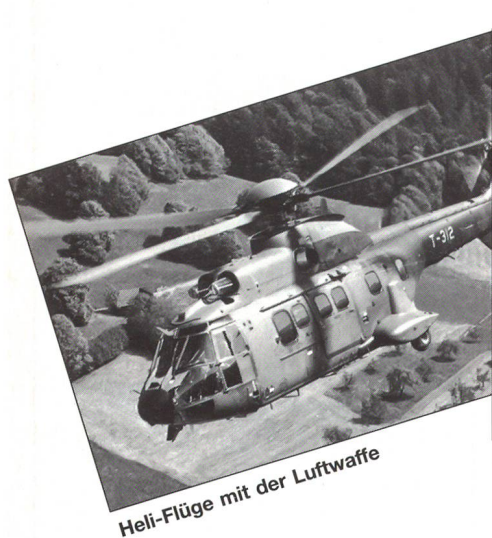
Heli-Flüge mit der Luftwaffe