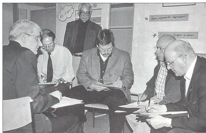
Man ist sich einig: Der Fragenkatalog für das Interview wird zu Papier gebracht.