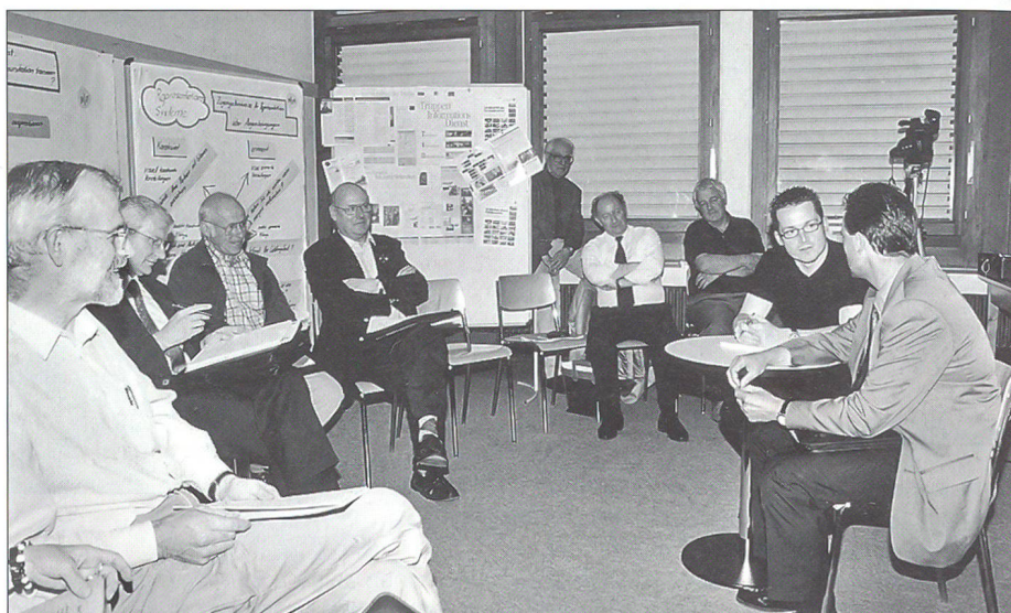
Das Interview im Massstab 1:1 wird von den Gruppenangehörigen interessiert verfolgt.

fanden die Autofahrer den Weg, die Bahnbenützer taten sich schon schwerer. Den Regionalzug nach Lattigen fanden zwar alle, aber dass man bei der gewünschten Station auf den Halteknopf hätte drücken sollen, hat niemand gemerkt. Erst nach einem längeren Fussmarsch «zurück» erreichte die Gruppe das AC-Zentrum.