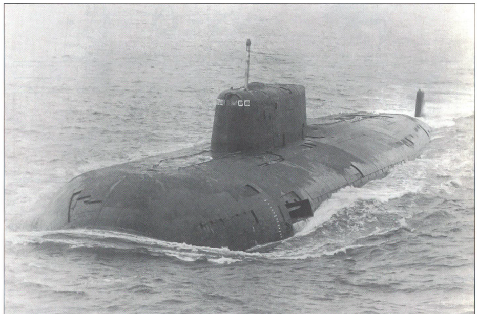
Eine Luftaufnahme der «Kursk», aufgenommen von einem P-3B-Langstreckenaufklärer «Orion» der Königlich-Norwegischen Luftwaffe. Die gewaltigen Ausmasse des Bootes sind auf den doppelten Rumpf (eine äussere und innere, die so genannte Druckhülle) zurückzuführen, die die Boote weniger verwundbar machen.

Die stattliche Zahl von über 120 U-Booten ist mit der derzeitigen desolaten Wirt- schaftslage Russlands eigentlich kaum vereinbar. Trotzdem beharrt die militä- rische Führung noch auf diesem ambitiö- sen Bestand. Dies, obschon die Mittel nicht mehr zu einer vernünftigen Ausbildung und Betrieb ausreichen. Bereits liegen zahlrei- che U-Boote ungewartet in den Häfen der Nord- und Pazifikflotte (Severomorsk, Mur- mansk, Archangelsk und Wladiwostok), die verrostenden und unsachgemäss oder überhaupt nicht entsorgten Nuklearreakto- ren geben dabei zu grosser Besorgnis An- lass. 2 Fachleute meinen zwar, dass von den automatisch abgeschalteten Reaktoren der «Kursk» keine unmittelbaren Gef- ahren ausgehen. Vor kurzem hat nun der russische Präsident Putin den Streitkräften weitere massive Abbaumassnahmen in Aussicht gestellt. Dazu dürfte vermutlich auch die im Dezember 2000 bekannt-