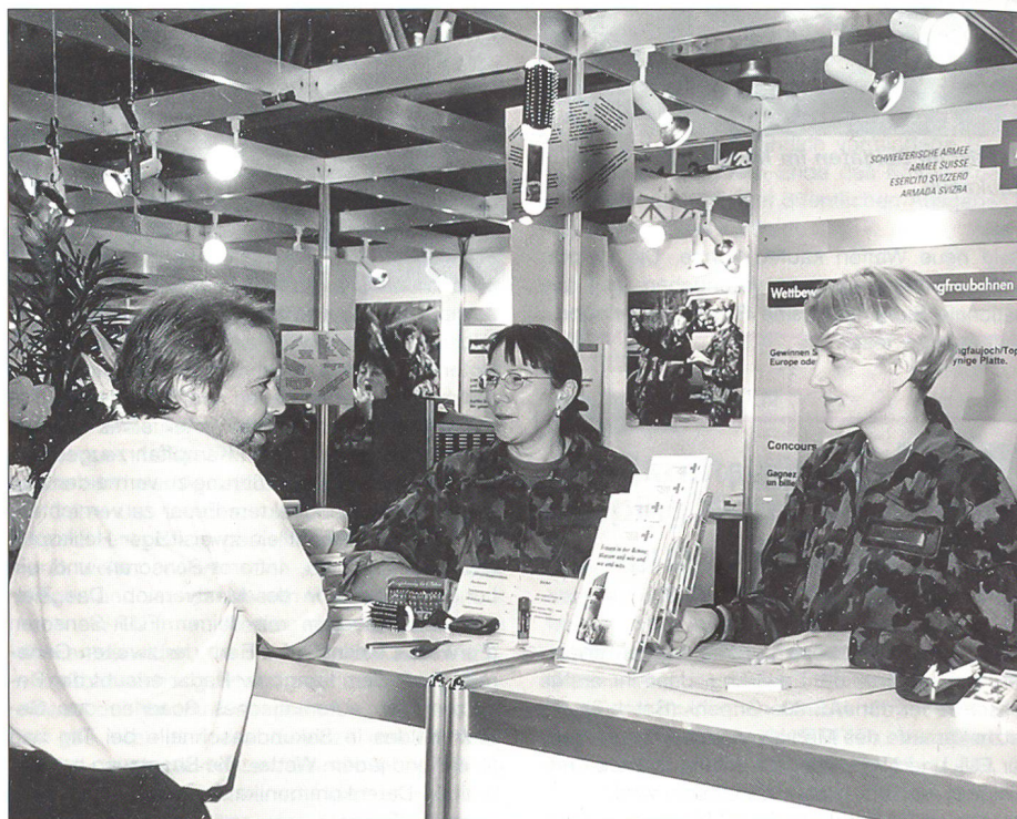
Auch Männer lassen sich über den Einsatz der Frauen in der Armee informieren.