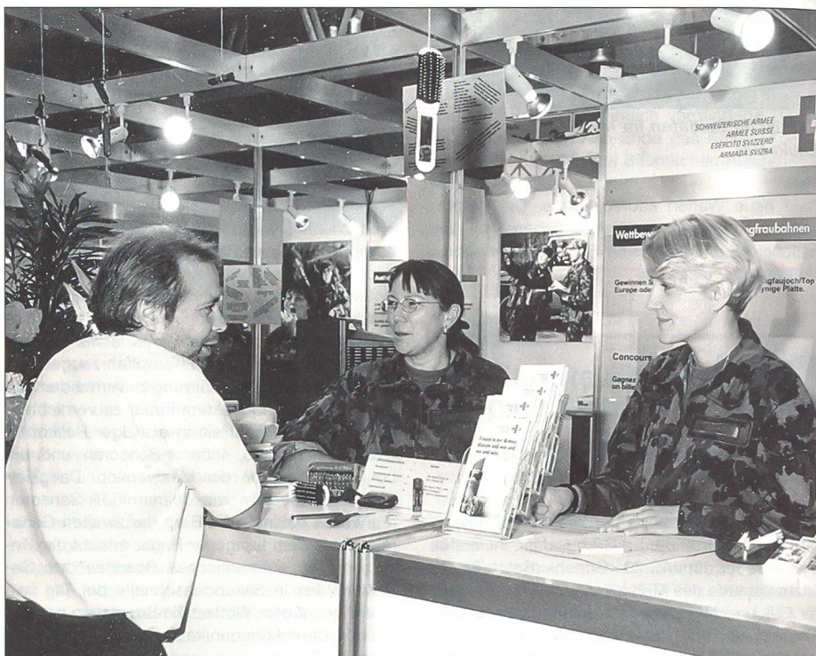
Auch Männer lassen sich über den Einsatz der Frauen in der Armee informieren.