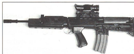
Enfield SA 80 (L 85 A 1)