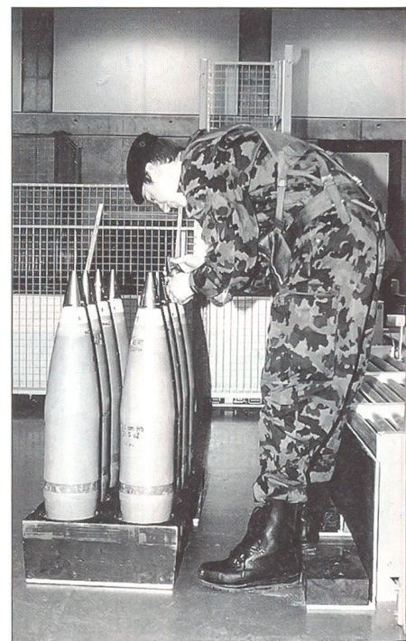
Im Schiesssimulator beim Tempieren der Art Granaten.