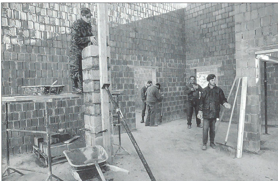
Von den Angehörigen der Swisscoy im Kosovo und in Mazedonien wird in erster Linie «Leistung im Einsatz» gefordert.

Mit diesen Erkenntnissen, die nicht allein für die Weltraumfahrt relevant sind, fand diese anspruchsvolle, hochinteressante Tagung einen würdigen Abschluss. ☒