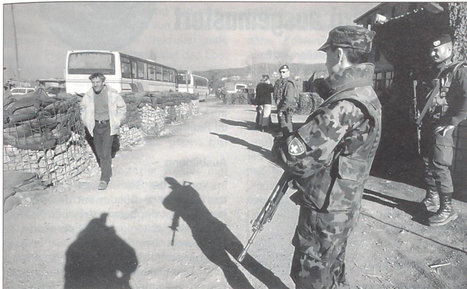
«Ja» zum Selbstschutz!

soll die Grundlage geschaffen werden, die Verfahrensabläufe zu vereinfachen. Der Bundesrat soll für die Ausbildungszusammenarbeit mit unseren Partnerstaaten Rahmenabkommen abschliessen können. Aus meiner Sicht würde es den sicherheitspolitischen Interessen unseres Landes zuwiderlaufen, wenn Kooperationen mit anderen Armeen drastisch beschnitten würden oder gar nicht mehr stattfinden könnten.