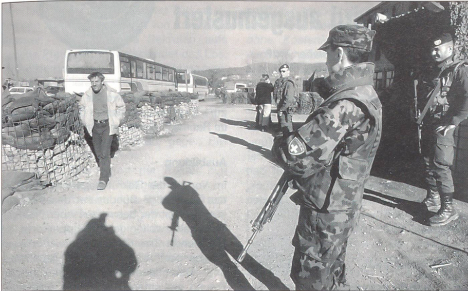
«Ja» zum Selbstschutz!

soll die Grundlage geschaffen werden, die Verfahrensabläufe zu vereinfachen. Der Bundesrat soll für die Ausbildungszusammenarbeit mit unseren Partnerstaaten Rahmenabkommen abschliessen können. Aus meiner Sicht würde es den sicherheitspolitischen Interessen unseres Landes zuwiderlaufen, wenn Kooperationen mit anderen Armeen drastisch beschnitten würden oder gar nicht mehr stattfinden könnten.