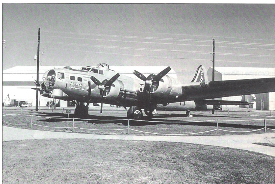
Boeing B-17G «Flying Fortress» der 8. Luftflotte der US Air Force.

Im Sommer 1944 hatten alliierte Besatzungen je nach Mission und Flugzeugtyp