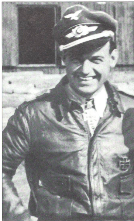
Heinz Bär wurde mit 16 bestätigten Abschüssen am Steuer einer Messerschmitt Me 262 der erfolgreichste Düsenjägerpilot des Zweiten Weltkriegs.

Im November 1942 betrat die 2. US-Infanterie-Division den nordafrikanischen Boden. Während der folgenden 30 Monate kämpfte sich die Division durch Marokko, Algerien, Tunesien, Sizilien, den italienischen Stiefel, Südfrankreich, Elsass bis nach Deutschland. Dieser Feldzug machte die 3. Infanterie-Division neben der 4., der 9., der 36. und der 45. Division zu einer der am meisten getroffenen Einheiten während des Zweiten Weltkriegs. Von den ursprünglich 235 Soldaten einer Kompanie der 3. Infanterie-Division, die 1942 an der Küste bei Casablanca in Nordafrika landete, waren Ende Januar 1945 noch genau zwei Soldaten am Leben.