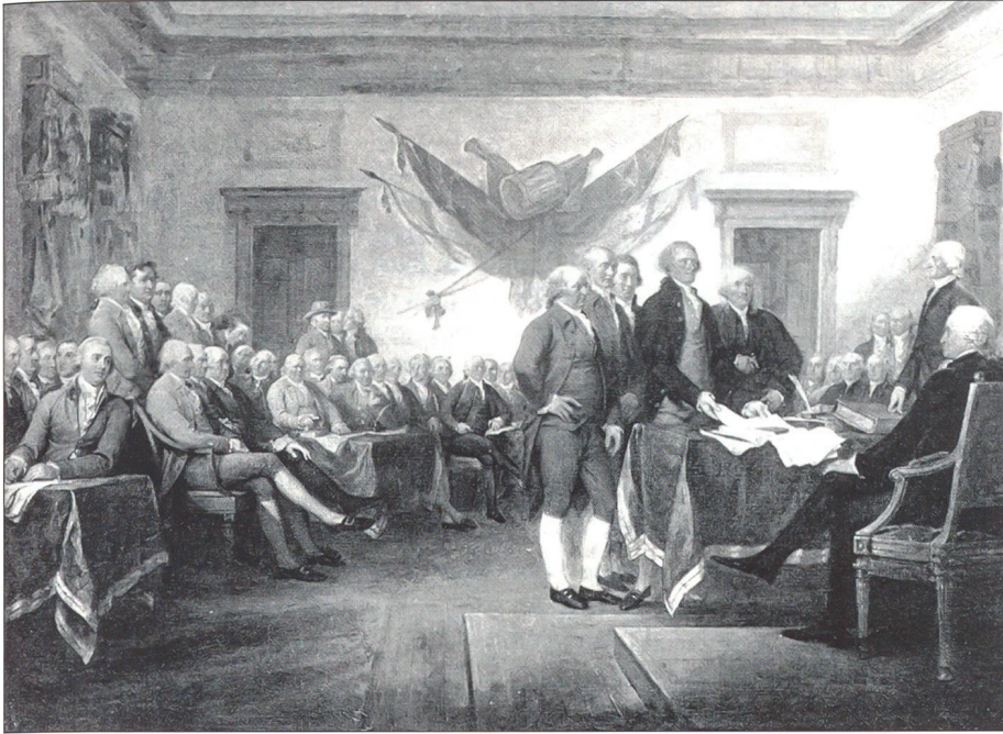
Unterzeichnung der amerikanischen Unabhängigkeitserklärung. Gemälde von John Trumbull (1756 – 1843). Thomas Jefferson überreicht im Namen des mit der Ausarbeitung beauftragten Ausschusses den Entwurf der Unabhängigkeitserklärung. Rechts neben ihm Benjamin Franklin.

geschaffenen USA sind ihrem ersten Präsidenten so wenig vertraut wie einst das Heer, dessen Oberkommandierender er geworden war. Er brachte wenig politische Erfahrung mit ins Amt. Erstmals sollten die neuen Theorien der Gewaltenteilung verwirklicht werden.