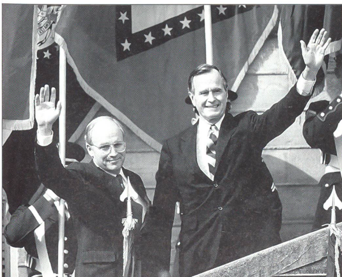
Der neue Chef des Pentagons ist Donald Rumsfeld. Der ehemalige Marineflieger war bereits ab November 1975 für 14 Monate unter Präsident Ford Verteidigungsminister.

Wenn eine Person in den USA schlicht nicht dem hier gängigen Klischee des Militärs gleichgesetzt werden kann, dann ist es sicher Powell. Denn dieser Mann hat trotz militärischer Laufbahn viele Jahre in zivilen Verwendungen verbracht und dürfte sich mit manchem «echten» Politiker bezüglich Wissen und Erfahrung messen können. Ganz abgesehen davon, dass Powell seit seinem Ausscheiden aus der Armee 1993 sich unter anderem intensiv mit gesellschafts-, sozial- und erziehungspolitischen Fragen befasst hat, erhielt er nach Einsätzen in Vietnam und einem