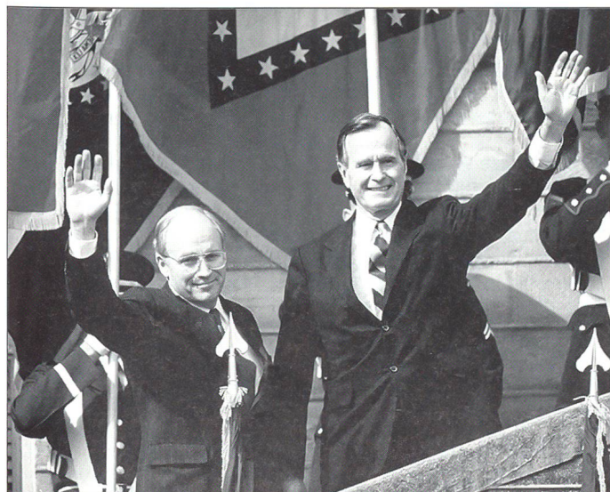
Der neue Chef des Pentagons ist Donald Rumsfeld. Der ehemalige Marineflieger war bereits ab November 1975 für 14 Monate unter Präsident Ford Verteidigungsminister.

Wenn eine Person in den USA schlicht nicht dem hier gängigen Klischee des Militärs gleichgesetzt werden kann, dann ist es sicher Powell. Denn dieser Mann hat trotz militärischer Laufbahn viele Jahre in zivilen Verwendungen verbracht und dürfte sich mit manchem «echten» Politiker bezüglich Wissen und Erfahrung messen können. Ganz abgesehen davon, dass Powell seit seinem Ausscheiden aus der Armee 1993 sich unter anderem intensiv mit gesellschafts-, sozial- und erziehungspolitischen Fragen befasst hat, erhielt er nach Einsätzen in Vietnam und einem