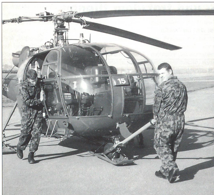
Eine Alouette 3 wird auf die Platte gezogen. Dadurch kann der Helikopter mit Muskelkraft verschoben werden.

erst lehrten sie uns die allgemeine Flugzeugkenntnis und auch die Kabinenkenntnis, damit man später bei den Wartungsarbeiten wusste, welcher Knopf überhaupt gemeint war, den man laut Vorschrift drücken musste. Später lernten wir die Helis retablieren, Flugbereitschaft erstellen,