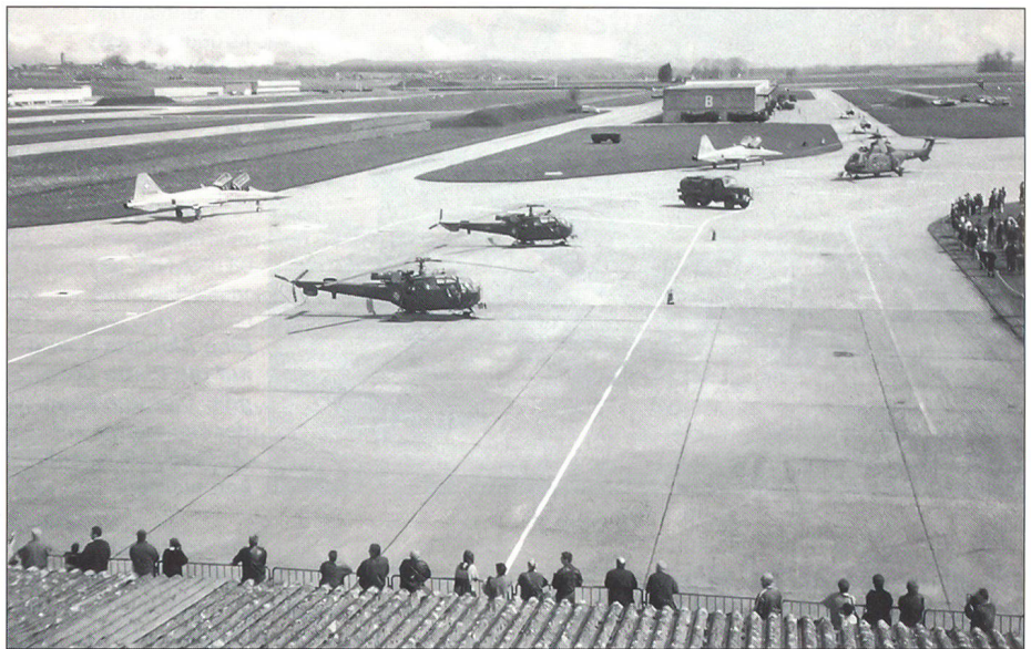
Am Besuchstag wird die gelernte Arbeit mit Stolz gezeigt.

Die erste Woche der RS war noch nicht so streng, aber chaotisch. Wir fassten jede Menge Material, lernten uns anzumelden,