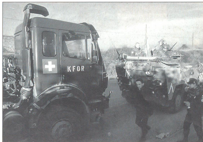
Die Swisscoy im Kosovo leistet in ihrem Abschnitt sehr gute Arbeit zugunsten der Zivilbevölkerung beim Wiederaufbau ihres Landes.