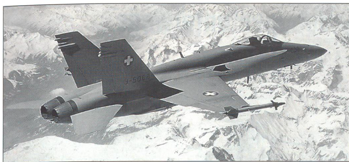
Der F/A-18C Hornet im Einsatz für die Luftraumsicherung.

denserzwingenden Aktionen ist jedoch ausgeschlossen.