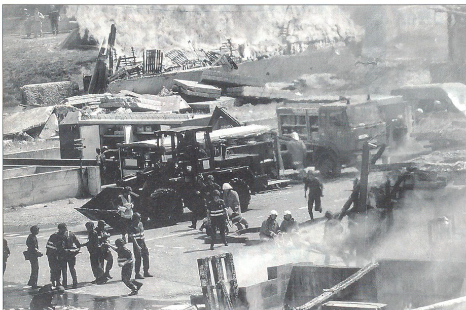
Rettungstruppen und Zivilschutz bekämpfen gemeinsam eine Feuerkatastrophe im Rahmen der Existenzsicherung.