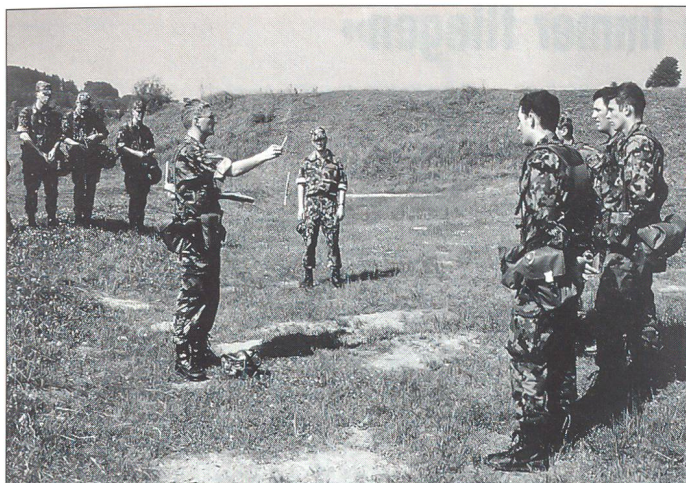
Der Chef qualifiziert die geleistete Arbeit.

dann auch nach unten angleichen. Weitere häufige «Beurteilerfehler» wie das Ersteindrucksurteil oder das Überbewerten von leicht beobachtbaren Nebensächlichkeiten sollten schon zuvor durch das Sammeln von ausreichendem Beobachtungsmaterial minimiert worden sein. Hat man das Qualifikationsformular auf diese Weise ausgefüllt, ist man zugleich in der Lage, einige Hinweise zu formulieren, wo und wie sich der Betreffende verbessern kann. Denn jede Beurteilung muss auch einen Fördereffekt haben, welcher dann vor allem im Eröffnungsgespräch zum Tragen kommt.