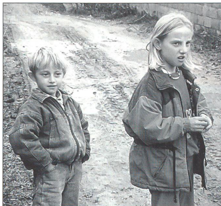
... und ihrer Zukunft

Alle Privilegien, die ein Instruktor der Schweizer Armee hat, sind im Ausland hin-fällig: Kein Dienstauto, andere Arbeits- und Einsatzzeiten, andere Kommandostruktur. Aufgabe und Auftrag stehen im Vordergrund und werden gemeinsam mit allen Swisscoy-Kadern gelöst. Teamfähigkeit, Flexibilität und Sprachgewandtheit sind ein absolutes Muss, um im heutigen inter-