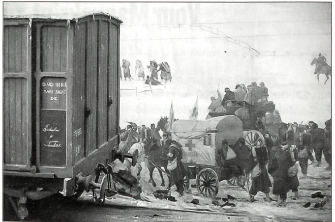
Ein Ambulanzfahrzeug transportiert kranke «Bourbakis».

barfuss, mit wunden, erfrorenen und eiternden Füßen, zitternd vor Kälte, gezeichnet durch Hunger und Entbehrungen, mühsam durch den Schnee. An der Grenze bildeten die Schweizer Soldaten eine Gasse, in der die Ankommenden ihre Waffen und Ausrüstung niederzulegen hatten. Die abgezeehrten Pferde frassen sich selber die Mähnen und die Schweife ab und Hunderte von ihnen, die entkräftet zu Boden gestürzt waren, mussten abgetan werden.