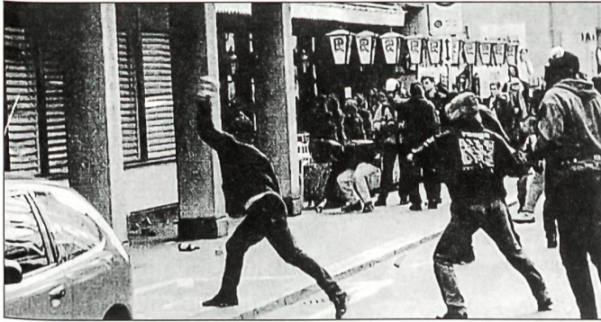
1.-Mai-Demonstration mit anschliessender «Sachbeschädigung».

wärts»; «jeder» schaue «aus jedem Ämtchen für sich den grösstmöglichen Vorteil zu ziehen.»