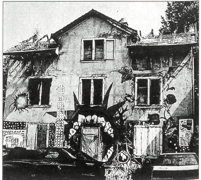
Hausbesetzung durch autonome Jugendliche.