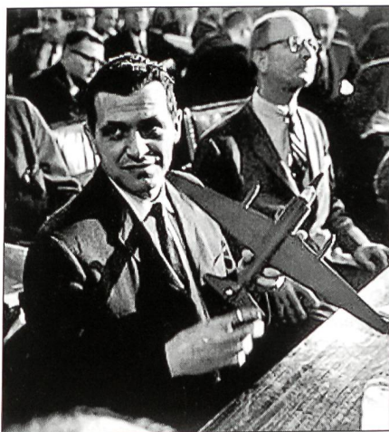
Pilot Francis Gary Powers während der Gerichtsverhandlung in Moskau.

Seit dem Beginn der U-2-Flüge am 4. Juli 1956 unternahmen die UdSSR alles, um die Eindringlinge abfangen zu können. Zahlreiche Boden-Luft-Raketen des Typs SA-1 wurden auf die Spionageflugzeuge abgefeuert. Doch ohne Erfolg. MiG-19-Abfangjäger stiegen auf, doch auch sie erreichten nicht die hoch fliegenden U-2. Um sie abfangen zu können, machten sich die Sowjets daran, bessere Waffensysteme zu entwickeln. Sie gingen zweigleisig vor: Aus der SA-1 entwickelten sie die SA-2 mit einer Dienstgipfelhöhe von 20 000 Metern, und auch der neue Abfangjäger Suchoi Su-9 sollte eine ähnliche Höhe erreichen. Als am 1. Mai 1960 Powers um 5.36 Uhr in den Luftraum der UdSSR einflog, ahnte er nichts. Zwar war die Entwicklung der SA-2 den USA bekannt, doch hofften die Einsatzplaner, die SA-2-Stellungen einfach umfliegen zu können. Als der Parteisekretär Chruschtschow über den weiteren Einflug einer U-2 orientiert wurde, war er ausser sich vor Wut. Er empfand diesen Flug als eine offene Provokation. Nur wenige Tage später – am 16. Mai – wollte er sich mit den USA, Grossbritannien und Frankreich in Paris zu Abrüstungsgesprächen treffen. Aber nun dieser Überflug. Chruschtschow befahl, die U-2 abzuschiessen. Alle Raketenstellungen und Luftwaffenstützpunkte entlang der Flugstrecke wurden alarmiert. Die abgefeuerten SA-1 sowie die aufgestiegenen MiG-19 blieben wieder erfolglos. Im Gegenteil: Im allge-