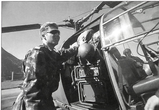
Auf in Bergeshöhen: Verlad einer Richt- strahlanlage in einen Helikopter.

in Anspruch nimmt. In unserer Brigade legen wir deswegen grösstes Gewicht auf massgeschneiderte Dienstleistungen. Wir wollen die richtige Person in der richtigen Funktion zur richtigen Zeit einsetzen. Dem Personalmanagement messen wir einen hohen Stellenwert zu. Gerade bei der Nachwuchsförderung des Kaders bemühen wir uns, Ausbildung und Dienstleistungen so festzulegen, dass wir den Bedürfnissen des Einzelnen möglichst entgegenkommen können. Jeder wird in seiner Funktion, in seinem Fach ausgebildet. Zusätzliches und bloss Wünschbares muss weggelassen werden. Als Gegenstück zu dieser Flexibilität fordern wir Kader wie Mannschaft im Militärdienst entsprechend.