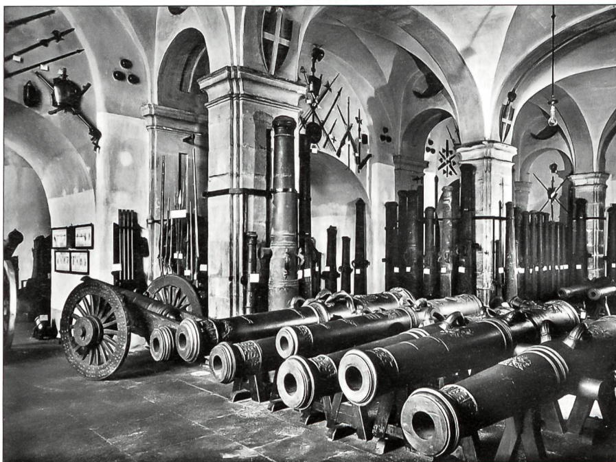
Geschützrohre des 18. Jahrhunderts.

nigliche Verfügung die Zusammenfassung aller Geschützmodelle, Originalmuster sowie des gesamten damit korrelierenden Artilleriematerials in einer Halle des Zeughauses, um damit eine systematische Sammlung aufzubauen. Durch die Gründung der königlichen Schule zur theoretischen und praktischen Ausbildung der jungen Artilleristen und Festungstruppen am 16. April 1739 wurde der tiefere Sinn der Sammlung erkennbar. Sie bildete die praktische Grundlage für die Anwendbarkeit des erlernten artilleristischen Wissens zum Wohle des savoyischen Staates. Durch Regelung vom 1. Dezember 1752 bezogen die Museumsdirektion und das mineralogische Laboratorium ihren Sitz im Zeughaus. Der Ausbildungsauftrag erforderte von nun ab die zusätzliche Beschäftigung mit den neuesten innovativen technischen Entwicklungen im Bereich des Geschützwesens, wodurch die Sammlung stetig wuchs. Durch den Einmarsch französischer Truppen 1798 litt der Sammlungsbestand erheblich. Erst nach der endgültigen Loslösung von der französischen Vorherrschaft 1842 setzte dank des energischen Vorgehens des hohen Rates der Artillerie der Wiederaufbau der Sammlung erfolgreich ein. Dies in umfassendem Sinne, wobei alle denkbaren Aspekte des Geschütz- und Geniewesens sektoriell berücksichtigt wurden. Das sichtbare Ergebnis dieser gemeinsamen Bemühungen führte dazu, dass das nunmehr in enormen Mengen angewachsene Material 10 Zeughaushallen belegte. Die Kollektion erfuhr in