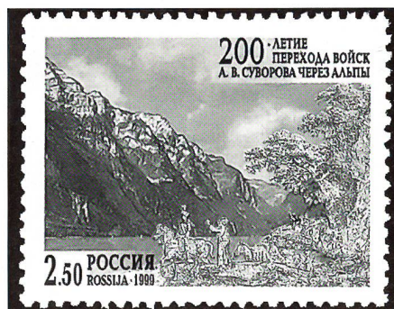
Gedenkmarken anlässlich des 200. Jahrestages der Alpenüberquerung Suworows.