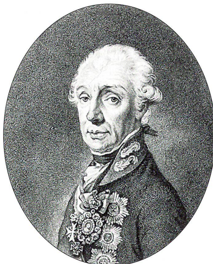
Alexander W. Suworow (1729–1800).

Suworow erreichte am 26. September Altdorf und merkte, dass er in einer Sackgasse steckte. Der alte Gotthardweg war damals in Flüelen zu Ende, und ein Weiterkommen war nur über den Urner See möglich. Weil die Franzosen alles schiffbare Material vernichtet oder mitgenommen hatten, setzte er seinen Marsch über den Kinzig-Kulm-Pass nach Muotathal fort. Doch die neue Lage zwang den General, auszuweichen und über den Pragel-Pass nach Osten ins Glarnerland zu stossen. Ein ungewöhnlich früher Wintereinbruch, fehlende Verpflegung, Mangel an Munition und die Erschöpfung der Truppe machten sich immer deutlicher bemerkbar. Trotzdem eroberte Suworow am 1. Oktober Glarus, versuchte aber vergeblich, an den Walensee zu stossen. Er musste über Elm und den Panixer Pass aus dem Glarnerland ins Bündnerland ausbrechen, um nicht den nachrückenden Franzosen in die Hände zu fallen. Am 10. Oktober erreichte er Chur. Etwa 15 000 Mann waren von den ursprünglich 21 000 übrig geblieben.