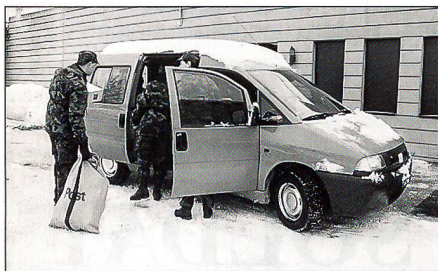
Post zustellen: Bei jeder Witterung ...

wenigen bekannt. Aber gewiss ist, dass viele Helfer im Hintergrund für eine schnelle Postabfertigung besorgt sind. Ihnen allen ist dieser Artikel als ein kräftiges Dankeschön der Wehrmänner gewidmet.