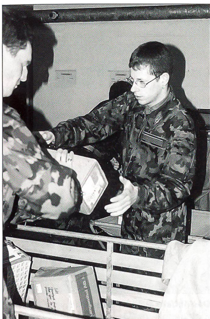
Einander in die Hände arbeiten.