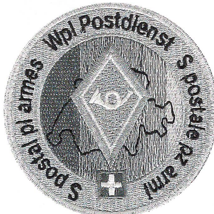
Oberarmbadge des Waffenplatz-Postdienstes.

Im Ausbildungsdienst erfolgt die Postversorgung einmal täglich. Der Bürger in Uniform kann folgende Sendungen, die seine