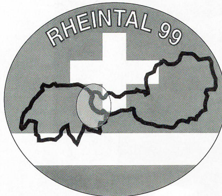
Signet der Stabsrahmenübung.