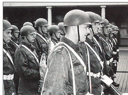
Ein Blick in die Reihen der vorarlbergischen Militärmusik.