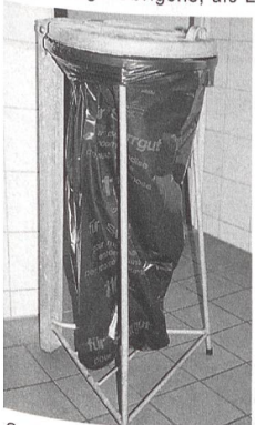
Sackhaltersystem, frühere Sammelgefässe

Worauf ist diese Zufriedenheit zurückzuführen? Sicher unterstützt das ästhetisch ansprechende Design und die geschmackvolle Integration in die Räumlichkeiten, einschliesslich farblicher Abstimmung, die Motivation der Anwender zur gewissenhaften Benützung. Das Konzept mit der schwenkbaren Einwurfsklappe trägt weiter dazu bei, dass die Person sich nochmals überlegt, ob der Einwurf in die richtige Sammlung erfolgt. Übrigens, die Elemente sind nur provisorisch für die Erprobungsphase beschriftet (s. Foto), demnächst erhalten sie die definitiven Symbolaufkleber direkt auf den Einwurfschwingendeckeln.