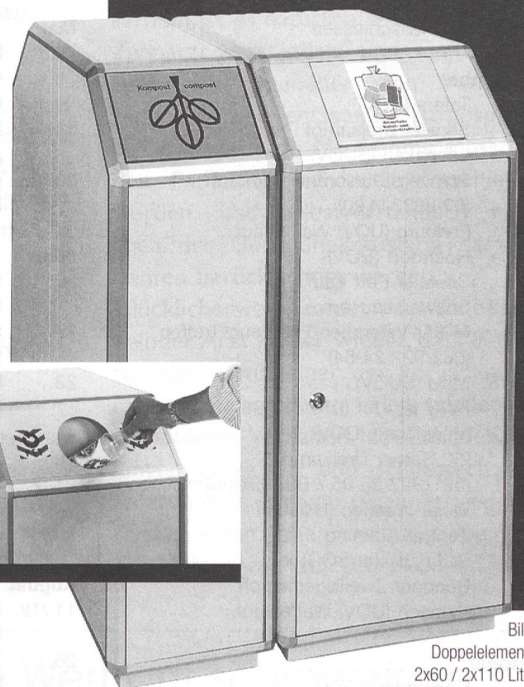
Bild: Doppелеlemente 2x60 / 2x110 Liter