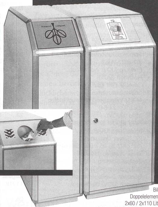
Bild: Doppelemente 2x60 / 2x110 Liter