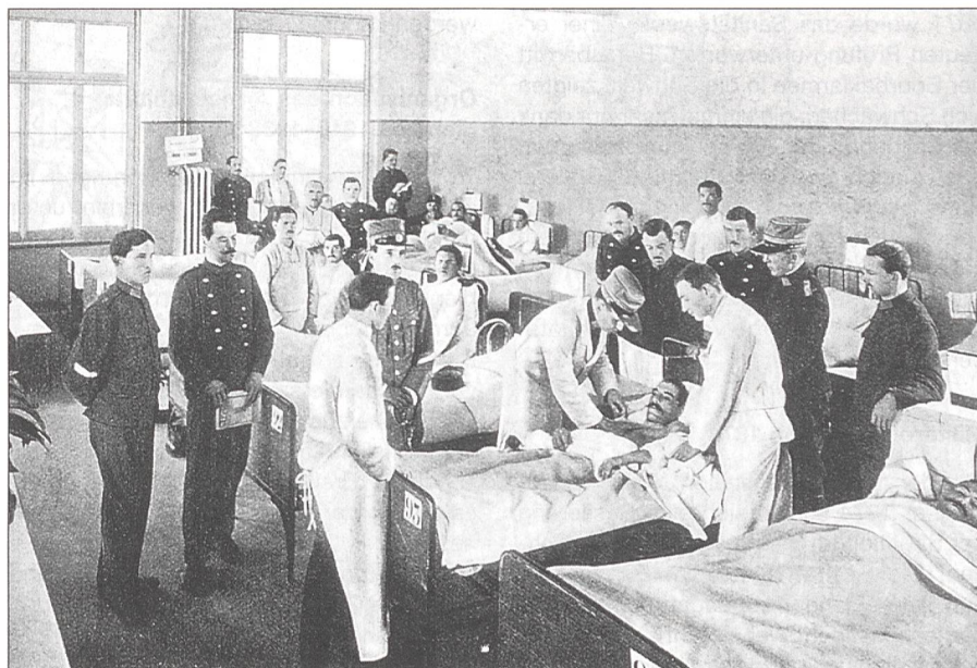
Das waren noch Zeiten ...

1798 wurde das Kriegskommissariat mit der obersten Leitung und Verwaltung des gesamten Kriegsmedizinwesens betraut. In der Folge erhielt jedes Bataillon einen Bataillonschirurgen im Hauptmannsrank und zwei Unterchirurgen im Unterleutnantsrang. Sanitätspersonal und Sanitätsformationen blieben aber streng kantonal geordnet. In jedem Kanton stand ein