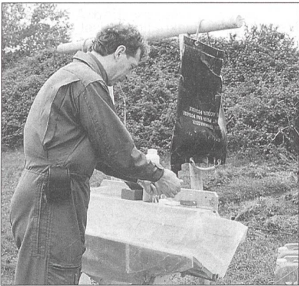
Das Wasser für die tägliche Toilette ist Mangelware.

Zurückgebliebenen gibt es heute Fondue. Nach dem Essen sitzt man zusammen, spricht von daheim. Meist auch von den Schrecken des Krieges. Die Eindrücke können zusammen mit den Kameraden verarbeitet werden. Spät in der Nacht kehren zwei Mechaniker total durchnässt ins Lager zurück und sind froh über eine warme Mahlzeit. Sie haben im strömenden Regen Reparaturarbeiten an den Helis ausgeführt.