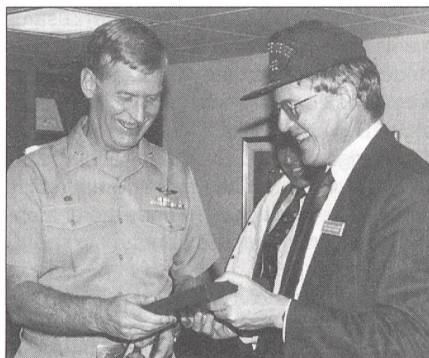
Bundesrat Kaspar Villiger erhält anlässlich seines Besuches an Bord der «USS Independence» vom 8. Februar 1990 in San Diego eine Erinnerungsplakette des Flugzeugträgers vom Kommandanten, Kapitän zur See Thomas Slater. Auch die berühmte Baseball-Mütze ist ein Souvenir von der Besatzung.

Am 10. Januar 1959 war der Träger in Dienst gestellt und der Atlantikflotte zugeteilt worden. Kapitän zur See McElroy war ihr erster Kommandant. Der noch junge Träger hatte zu diesem Zeitpunkt bereits eine bewegte Zeit hinter sich. Im Oktober 1962 war er vor die Küste Kubas zur Unterstützung der Blockade beordert worden. Nach meiner Ankunft spürte man bald einmal, dass das Schiff zudem erst wenige Monate zuvor – am 13. Dezember 1965 – aus einem weiteren Kriegsgebiet nach Norfolk zurückgekehrt war. Als erster Flug-