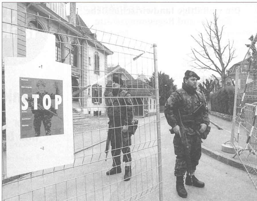
19. März 1999; Bern, Nähe israelische Botschaft: Angehörige des Infanterieregimentes 13 im «Einsatz der Armee zum Schutze bedrohter Einrichtungen» (Bundesbeschluss vom 21. April 1999).

2. Gooooooooooooooooooooooooooooool! äh... Fenster. Relax! 0800 80 80 80 anrufen, und wir organisieren den Glaser. Auch am Samstag. Und auch am Sonntag.