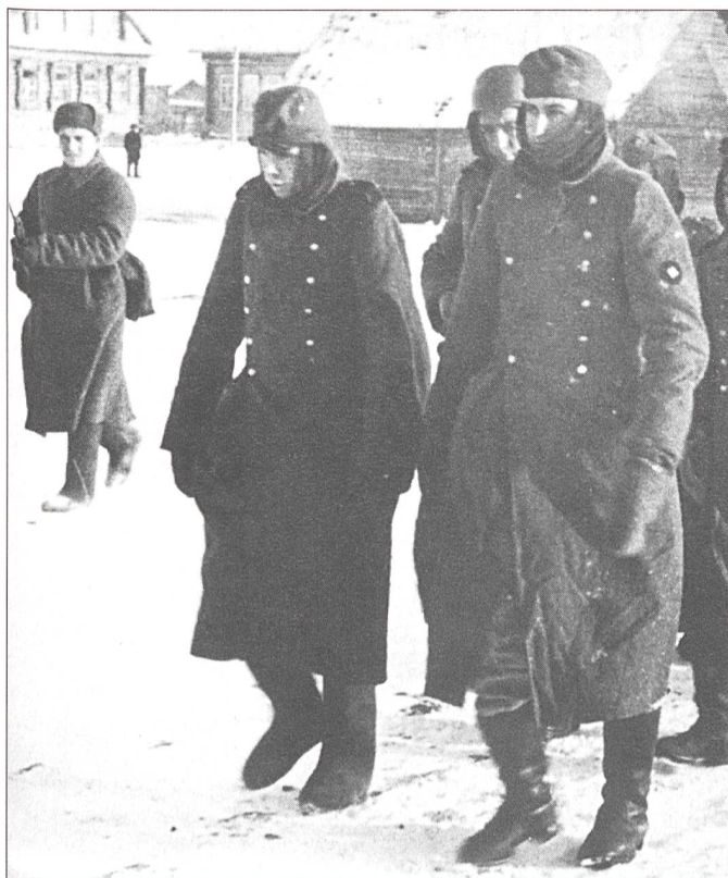
Januar 1943: Stalin-grad (heute Wolgograd) – die grösste militärische Niederlage der deutschen Wehrmacht im Zweiten Weltkrieg.

gangen, hätte er auf eigene Initiative Ende Dezember 1942 bedeutende Reste der 6. Armee retten können. Dann aber wäre seine Militärlaufbahn beendet gewesen. Manstein wagte jedoch nicht, gegen Hitlers Entscheid aufzutreten, als Folge: die 6. Armee ging Anfang Februar 1943 elend zugrunde.