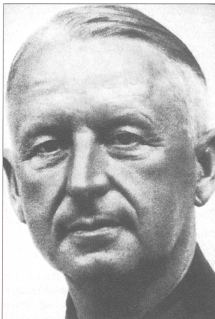
Generalfeldmarschall Erich von Manstein

Im Juli 1935 wurde von Manstein als Chef der Operationsabteilung in den Generalstab des Heeres berufen. Ein Jahr später ist er General, erster Gehilfe des Oberquartiermeisters. Er sollte bald Vertreter des Generalstabschefs Ludwig Beck werden. Seine Laufbahn war bereits zu diesem Zeitpunkt vorgezeichnet. Am 5. November 1937 bestellte Hitler die Oberbefehlshaber der drei Wehrmachtteile, den Kriegsmarine und den Aussen-