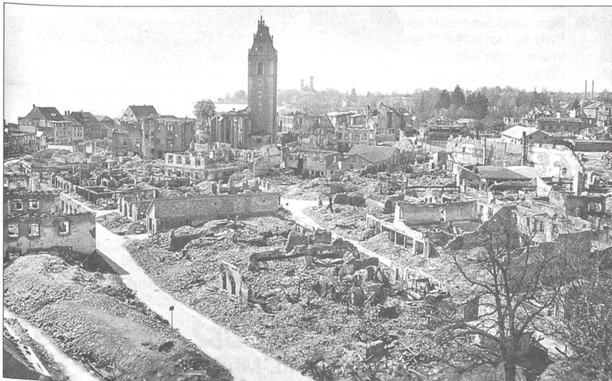
Friedrichshafen liegt in Schutt und Asche.

Ich bin dienstlich in Visp zur Kontrolle unseres Korpsmaterials.